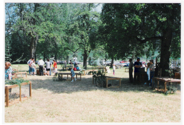
Jungtierschau in den 1990er Jahren